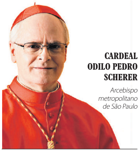
CARDEAL ODILO PEDRO SCHERER