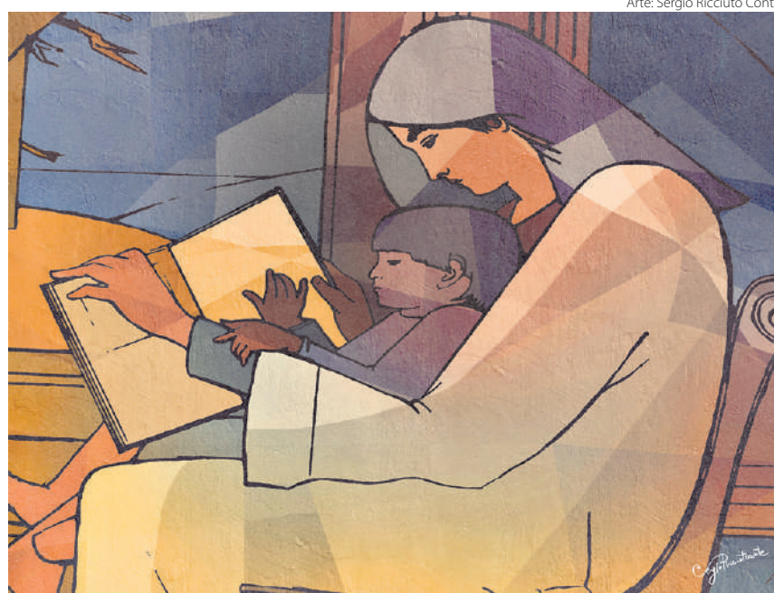
Arte: Sergio Ricciuto Conte

Nossa sociedade, contudo, tem assistido a uma demolição cultural da maternidade. De um lado, acostumamo-nos a desconsiderar as nossas falhas, ao mesmo tempo em que cobramos perfeição dos demais. Assim, o amor materno, tão falível quanto qualquer outra experiência humana,