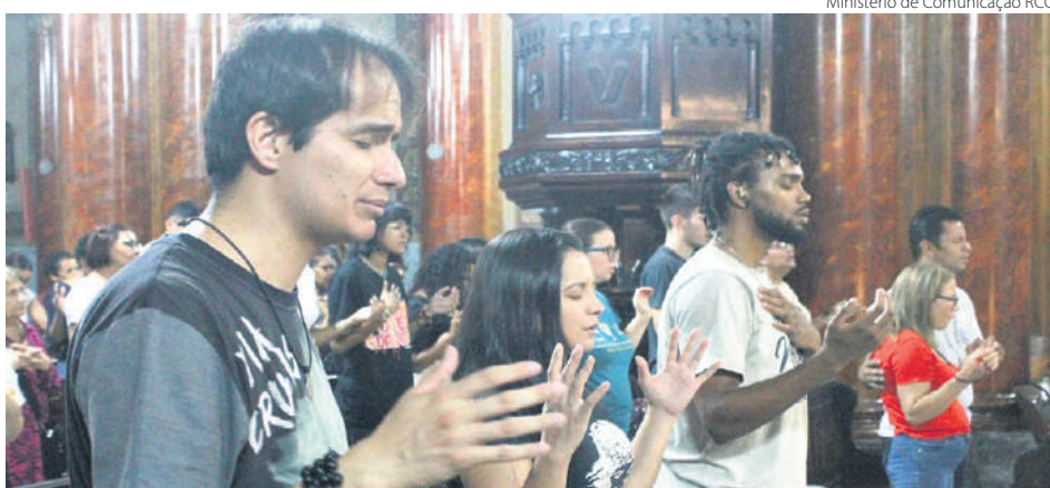
Ministério de Comunicação RCC