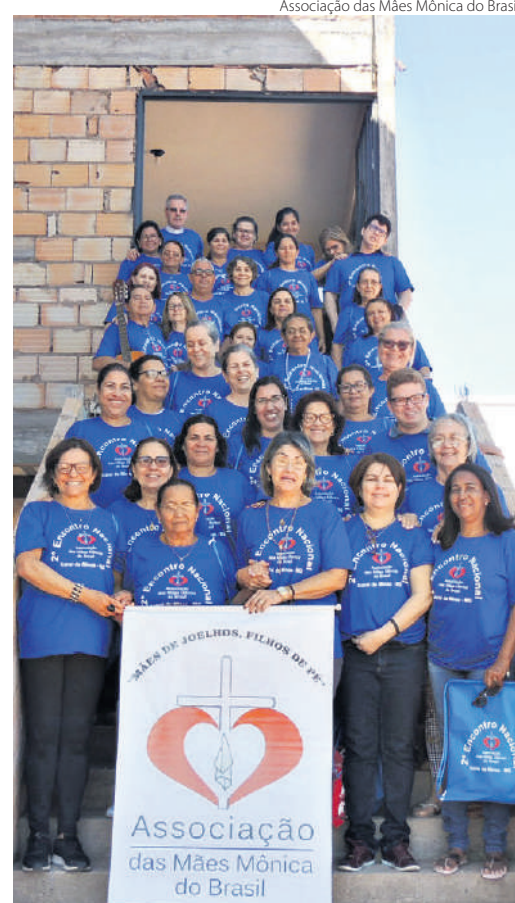
Associação das Mães Mônica do Brasil

Integrantes das iniciativas ‘Mães que oram pelos filhos’ e ‘Mães Mônica’ testemunham a todo o mundo a força da intercessão materna