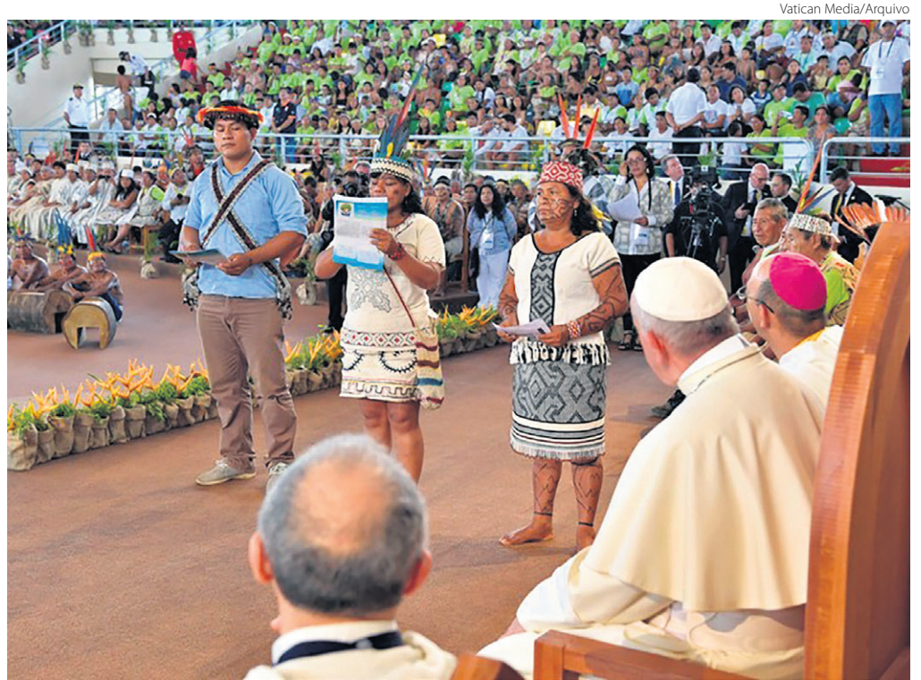
Papa Francisco em encontro com os povos da Amazônia em Puerto Maldonado, no Peru, em 2018

O primeiro capítulo é concluído com reflexões sobre o necessário processo de conversão ecológica, o qual “supõe uma mudança do nosso modo de ser, pensar e agir como pessoas e comunidade. Buscamos um modo de viver mais integrativo entre Deus, os seres humanos e toda a criação, no qual a cultura do amor e da paz tenha a primazia. Os apelos para uma conversão ecológica propostos pelo Papa Francisco na Laudato si' permitem resgatar uma Ecologia Integral, unindo fiéis e não fiéis na missão da Casa Comum, construindo grandes e pequenas alianças, reforçando laços da Amizade Social” (CF 56).