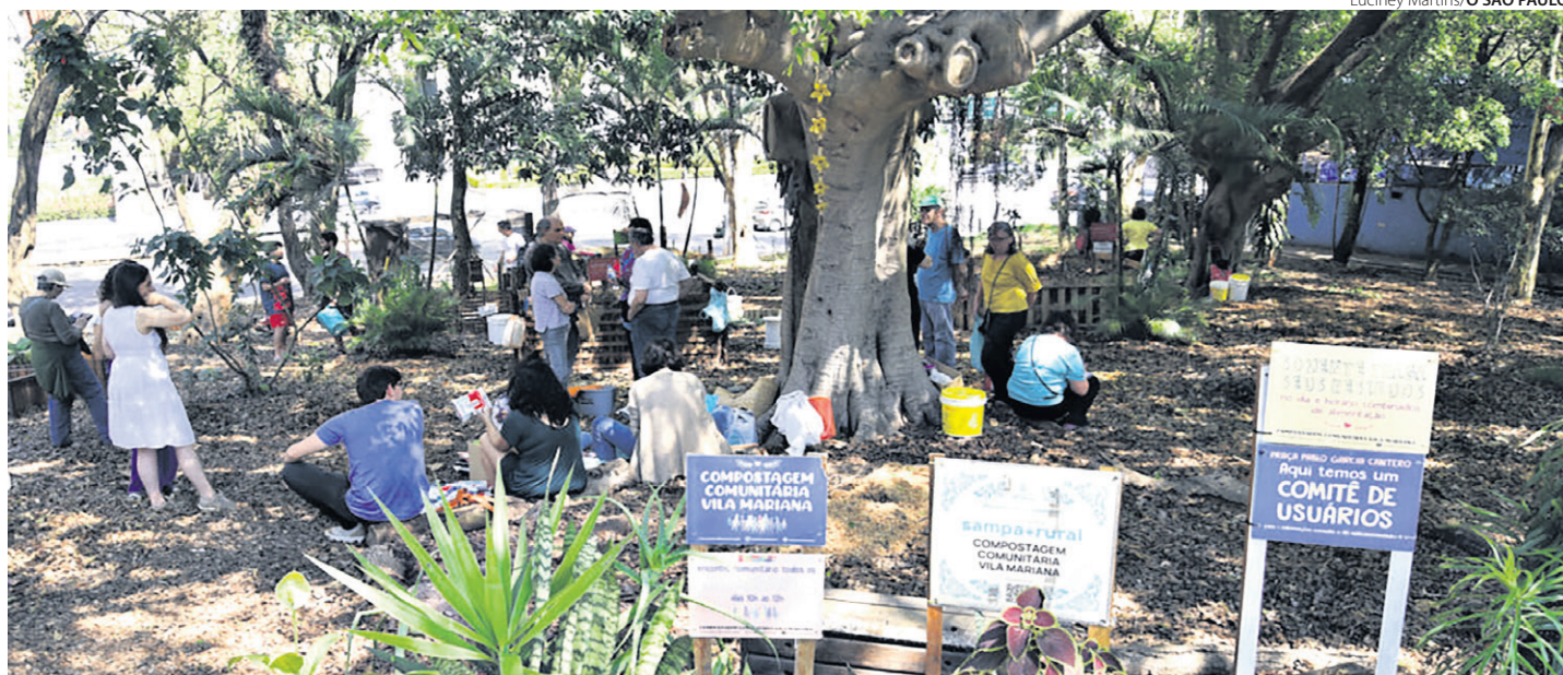
Voluntários do programa Ecobairro em São Paulo. CF 2025 convida a ações individuais e de incidência social com vistas à Ecologia Integral

Por isso, na Campanha da Fraternidade de 2025, cujo tema é a Ecologia Integral, uma justa reflexão deve ter como conceitos iniciais e temas transversais o maravilhamento diante da beleza da criação e o cuidado para com a Casa Comum. O bom e o verdadeiro se manifestam, em todo o seu esplendor, na beleza – que é mais do que um sentimento estético, mas sim o sinal da profunda correspondência entre a realidade e o nosso coração. Não basta conhecer os males que nossa sociedade traz para a natureza e para si própria: para fazer o bem, temos que estar guiados pela verdade e pela beleza. Não basta uma visão moralista ou militante das práticas ambientais (algo como “temos que fazer isso para evitar uma catástrofe ambiental”). Grandes males virão do descaso com o meio ambiente, mas o “cuidado com a Casa Comum” se baseia em duas virtudes fundamentais: o respeito e a ternura – virtudes essas cada vez mais esquecidas em nossa sociedade individualista e niilista. Quem aprende a respeitar, respeita as pessoas, os demais seres vivos e até as coisas com as quais se relaciona; quem aprende a amar, demonstra ternura e cuidado com tudo que o cerca.