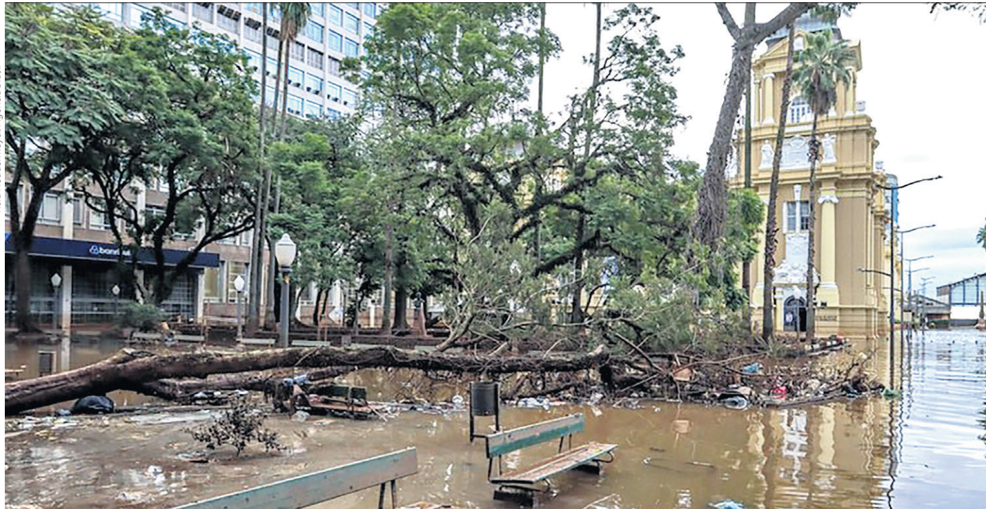
Eventos climáticos extremos, como as inundações ocorridas no Rio Grande do Sul em 2024, têm sido recorrentes em muitas partes do mundo

natureza inclui todos os aspectos da vida, como o meio ambiente, a família, a sexualidade e a cultura. “Na mesma encíclica, afirma que ‘a natureza está à nossa disposição, não como ‘um monte de lixo espalhado por acaso’, mas como um dom do Criador que traçou os seus ordenamentos intrínsecos dos quais o homem há de tirar as devidas orientações para a ‘guardar e cultivar’ (CV 48)’” (CF 110).