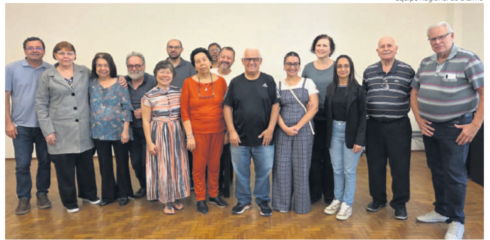
Equipe Regional do Dízimo