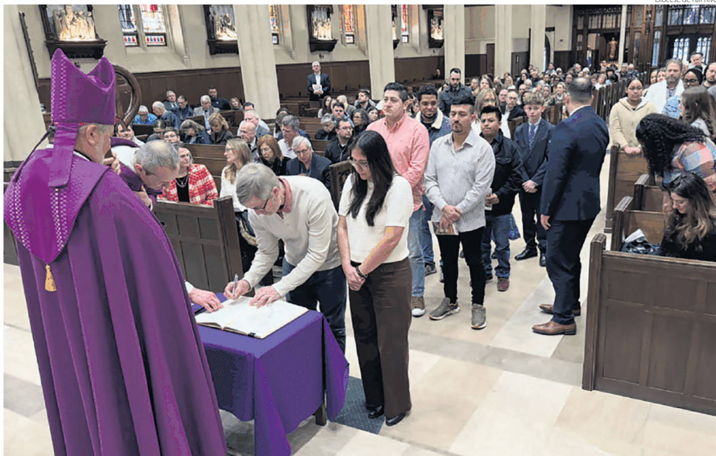
Na Diocese de Fall River, nos Estados Unidos, 110 fiéis, entre jovens e adultos, recebem os sacramentos da iniciação à vida cristã

Dom Cristiano, que é responsável pela região central da Diocese de Boston e cuida da comunidade de imigrantes brasileiros e latinos, tem testemunhado essa tendência principalmente em decorrência de um cansaço e pre-