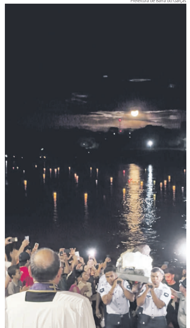
Procissão dos Barquinhos Iluminados ocorre no Rio Araguaia na cidade de Barra do Garças (MT), seguida da chegada do Senhor Morto

Campos] e os padres da cidade ficam à espera da imagem do Senhor Morto para, depois, levá-la em procissão até a Paróquia Santo Antônio”, detalhou Padre Cristiano.