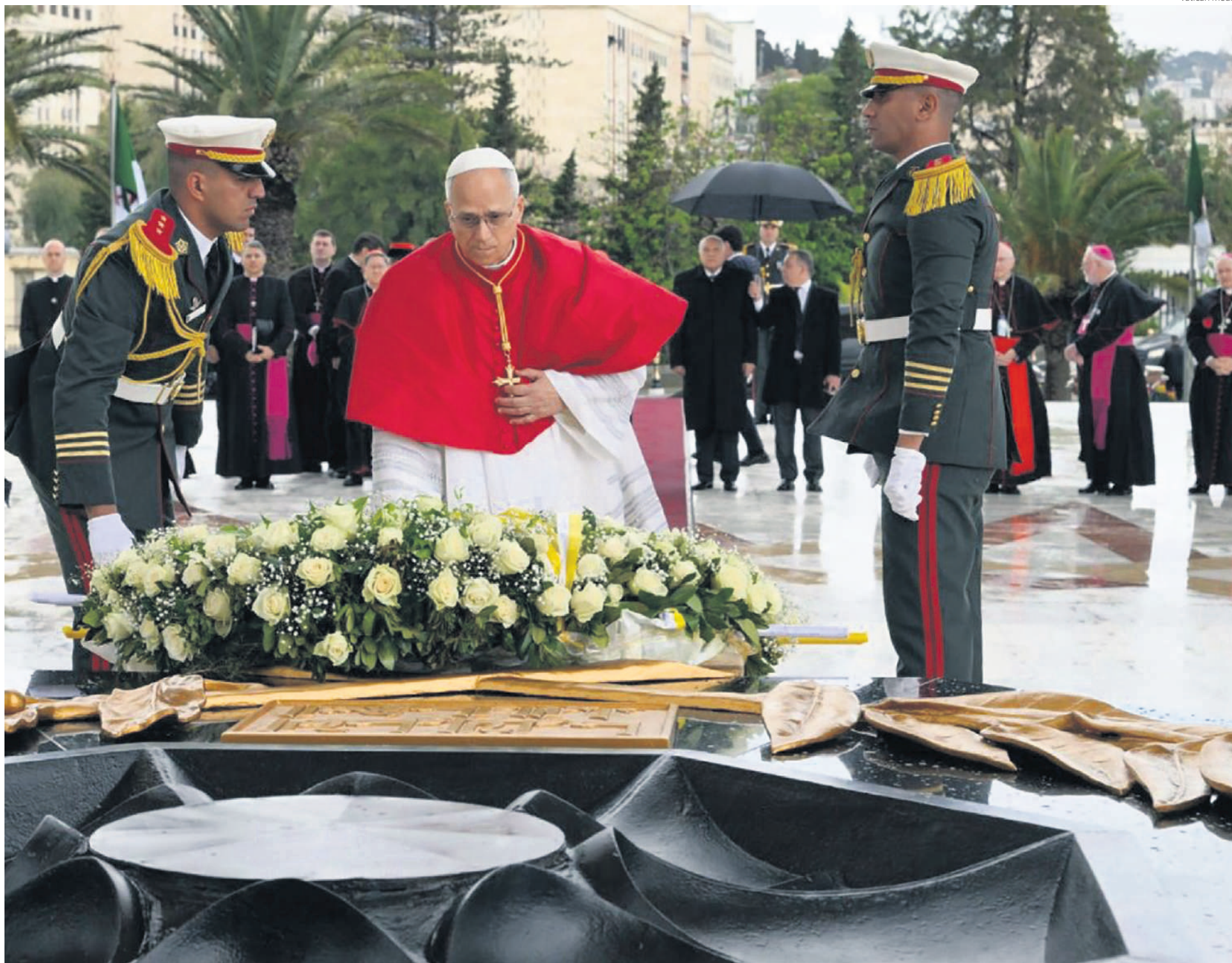
Na Argélia, Leão XIV realiza oração silenciosa no Monumento aos Mártires Maqam Echahid; viagem apostólica prossegue por Camarões, Guiné Equatorial e Angola nos próximos dias

A viagem apostólica do Papa Leão XIV à Argélia, na segunda-feira, 13, e na terça-feira, 14, foi marcada pelo forte apelo do Pontífice para que todos renovem os corações, buscando o encontro com Deus, bem como vivam a “cultura do encontro” na caridade e na simplicidade.