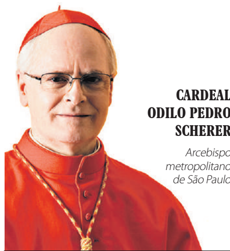
CARDEAL ODILO PEDRO SCHERER