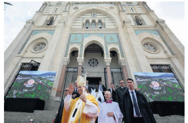
Papa fala a autoridades argelinas, visita a Grande Mesquita de Argel e preside missa na Basílica de Santo Agostinho

“Também a sociedade argelina conhece a tensão entre o sentido religioso e a vida moderna. Aqui, como em todo o mundo, tendem a manifestar-se dinâmicas opostas, de fundamentalismo ou de secularização, pelas quais muitos perdem o sentido autêntico de Deus e da dignidade de todas as suas criaturas”, afirmou. Portanto, “é preciso educar para o senso crítico e a liberdade, para a escuta e o diálogo, para a confiança que nos faz ver no diferente um companheiro de viagem, e não uma ameaça”.