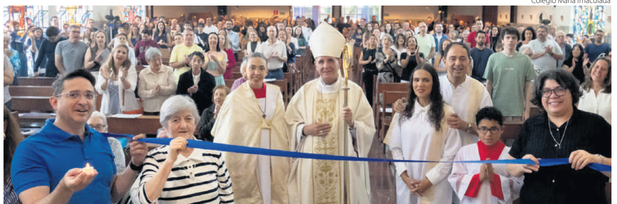
Colégio Maria Imaculada

(por Vicariato para a Educação a Universidade)