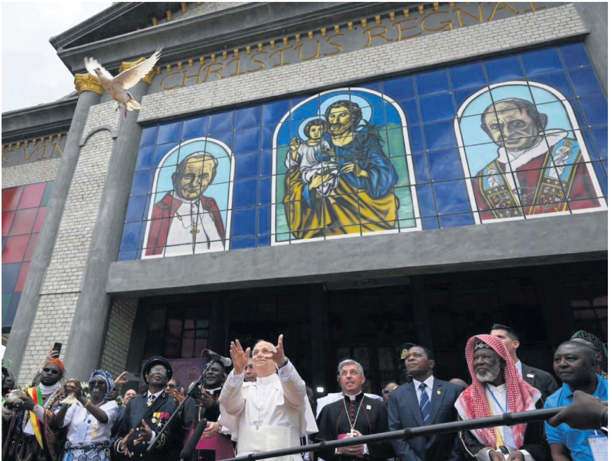
Em Camarões, na quinta-feira, 16, Papa Leão XIV participa do Encontro pela Paz, na Catedral de São José, em Bamenda, e adverte para que não haja instrumentalização das religiões

Um encontro com a comunidade católica, na segunda-feira, 20, foi o último compromisso público do Papa Leão XIV em sua passagem por Angola, terceira etapa da viagem apostólica que realiza pelo continente africano e que será concluída na Guiné Equatorial, na quinta-feira, 23.