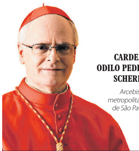
CARDEAL ODILO PEDRO SCHERER