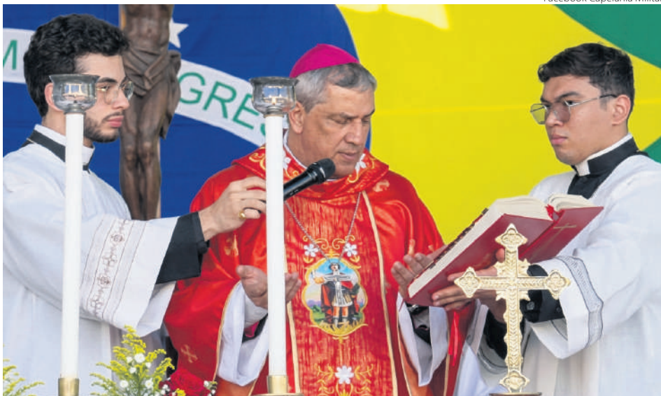
Facebook Capelania Militar

(por Secretariado de Comunicação Regional )