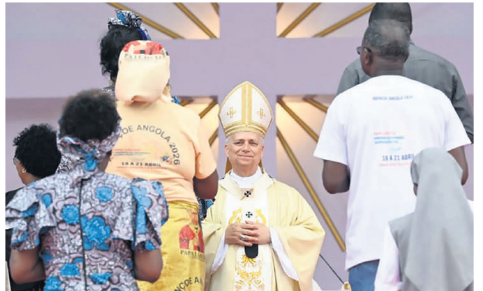
Em Angola, Pontífice lembra ao mundo que a África é 'uma reserva de alegria e esperança'

No Santuário de Maria "Mama Muxima", Leão XIV rezou o Terço e exaltou a figura de Nossa Senhora no título local. A palavra "Muxima" em língua