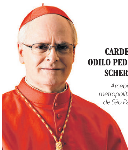
CARDEAL ODILO PEDRO SCHERER