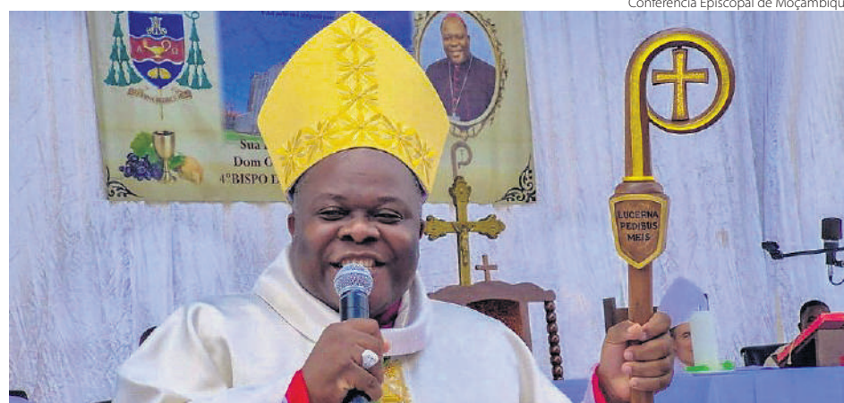
Conferência Episcopal de Moçambique

das Conferências Episcopais da África e Madagascar disseram receber com “profundo choque, tristeza e indignação a notícia do violento assassinato do Dom Osório Afonso”, e ressaltaram que o fato “constitui não só um atentado à vida e à dignidade de um servo devoto do Evangelho, mas também um atentado aos valores fundamentais da paz,