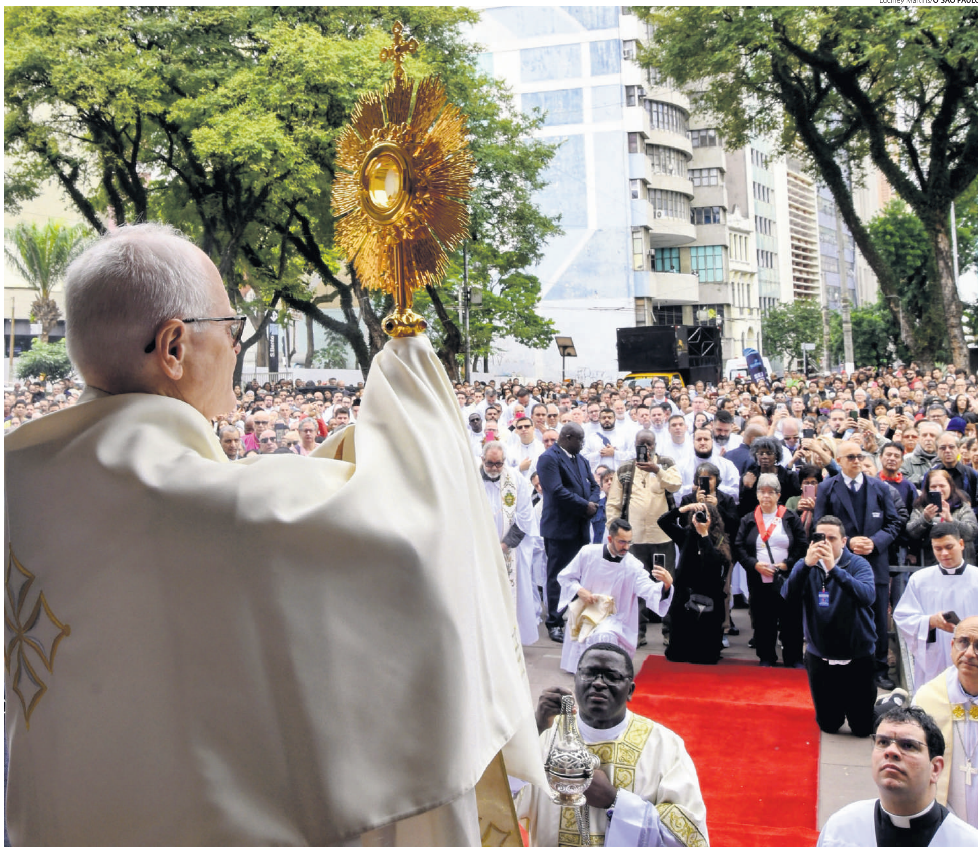
Em frente ao Mosteiro de São Bento, Cardeal Odilo Pedro Scherer abençoa os fiéis com o Santíssimo e pede as bênçãos de Deus para a cidade e a Igreja em São Paulo