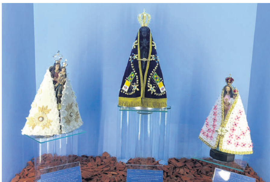
Província Franciscana da Imaculada Conceição do Brasil

Já outra apresenta uma versão alada da Imaculada