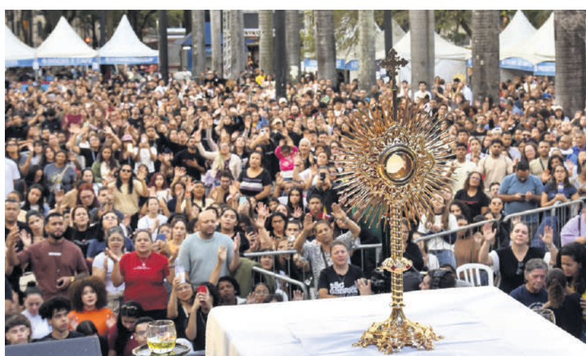
Festival Halleluya , dias 6 e 7, tem momentos oracionais, adoração e shows com artistas católicos na Praça da Sé, e missas na Catedral

de”, explicou Breno Dias. “Muitas vezes, olhamos para esta grande selva de pedra e enxergamos apenas o cansaço, a violência, a falta de esperança. Afirmar que Deus habita esta cidade, porém, é proclamar o senhorio de Cristo sobre a nossa história e recordar que existe paz em São Paulo quando abrimos espaço para a presença de Deus.”