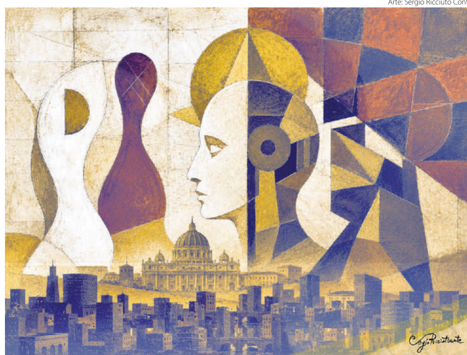
Arte: Sergio Ricciuto Conte

Leão XIV demonstra compreender que a inteligência artificial não é apenas um avanço tecnológico, mas uma questão moral, antropológica e espiritual. Seu olhar ultrapassa os limites da engenharia e alcança aquilo que define a própria dignidade humana. Ao “calcular” os riscos e possibilidades deste novo tempo, o Papa igualmente recorda que nenhuma inteligência criada