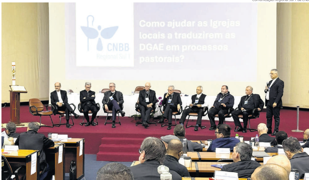
Comunicação Regional Sul 1 da CNBB

O Regional Sul 1 da Conferência Nacional dos