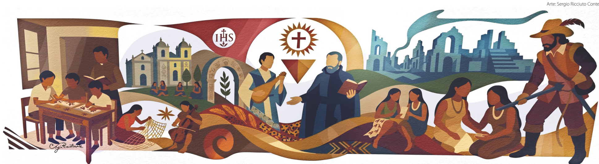
Arte: Sergio Ricciuto Conte

Em 2026, celebram-se os 400 anos do início das Reduções Jesuítico-Guarani, tema deste Caderno Fé e Cultura, no Sul do Brasil. Representam um dos episódios mais fascinantes e controversos da história das Américas. Por 130 anos, combinaram relativa autonomia político-econômica indígena com inserção no mundo colonial ibérico. Contudo, era uma aventura liderada por jesuítas, que tinham por meta a inculturação do Evangelho entre os nativos. Para a crítica contemporânea, isso parece imperdoável – ainda que raras vezes os povos indígenas encontrassem uma proposta tão respeitosa com seus direitos.