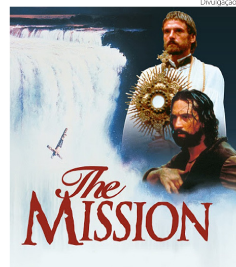
A MISSÃO (The Mission) Direção: Roland Joffé. Roteiro: Robert Bolt. Elenco: Robert De Niro, Jeremy Irons, Ray McAnally. Produção: Goldcrest Films, Kingsmere, Enigma Productions (Inglaterra, 1986). Duração: 125 minutos.

Como acontece frequentemente nos filmes, mesmo quando simpáticos ao catolicismo e à fé cristã, deve ser tomado como obra de entretenimento, não como registro da história real.