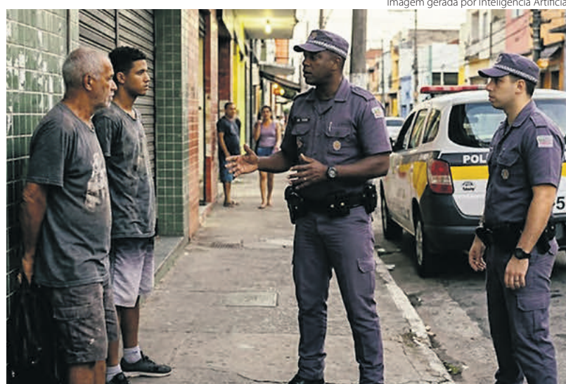
Imagem gerada por Inteligência Artificial

O rigor necessário não é o da força indiscriminada. É o do POI: saber onde agir, usar a força com proporção e não confundir eficiência com brutalidade. Esse caminho funciona quando aplicado com continuidade e seriedade. O desafio é fortalecê-lo, corrigindo seus desvios e ampliando seus êxitos.