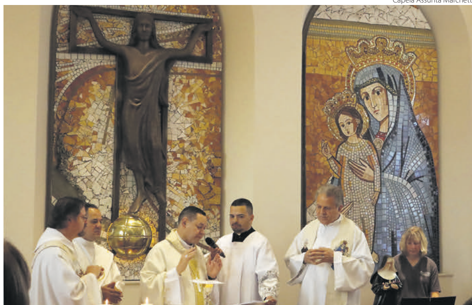
Capela Assunta Marchetti

Na homilia, Dom Cícero ressaltou as virtudes de Assunta Marchetti, em especial sua assistência aos órfãos de migrantes e ex-escravos. Ao final da celebração, o Episcopo abençoou os fiéis com a relíquia de primeiro grau da Beata. (FA)