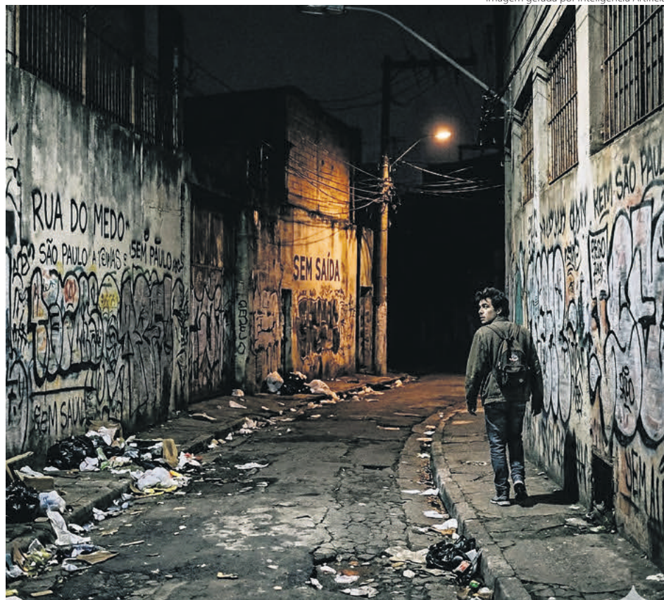
Imagem gerada por Inteligência Artificial

mos” (cf. FT 287). Não é apenas uma norma moral, mas um critério de eficiência sempre que desejamos construir o bem comum.