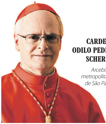
CARDEAL ODILO PEDRO SCHERER