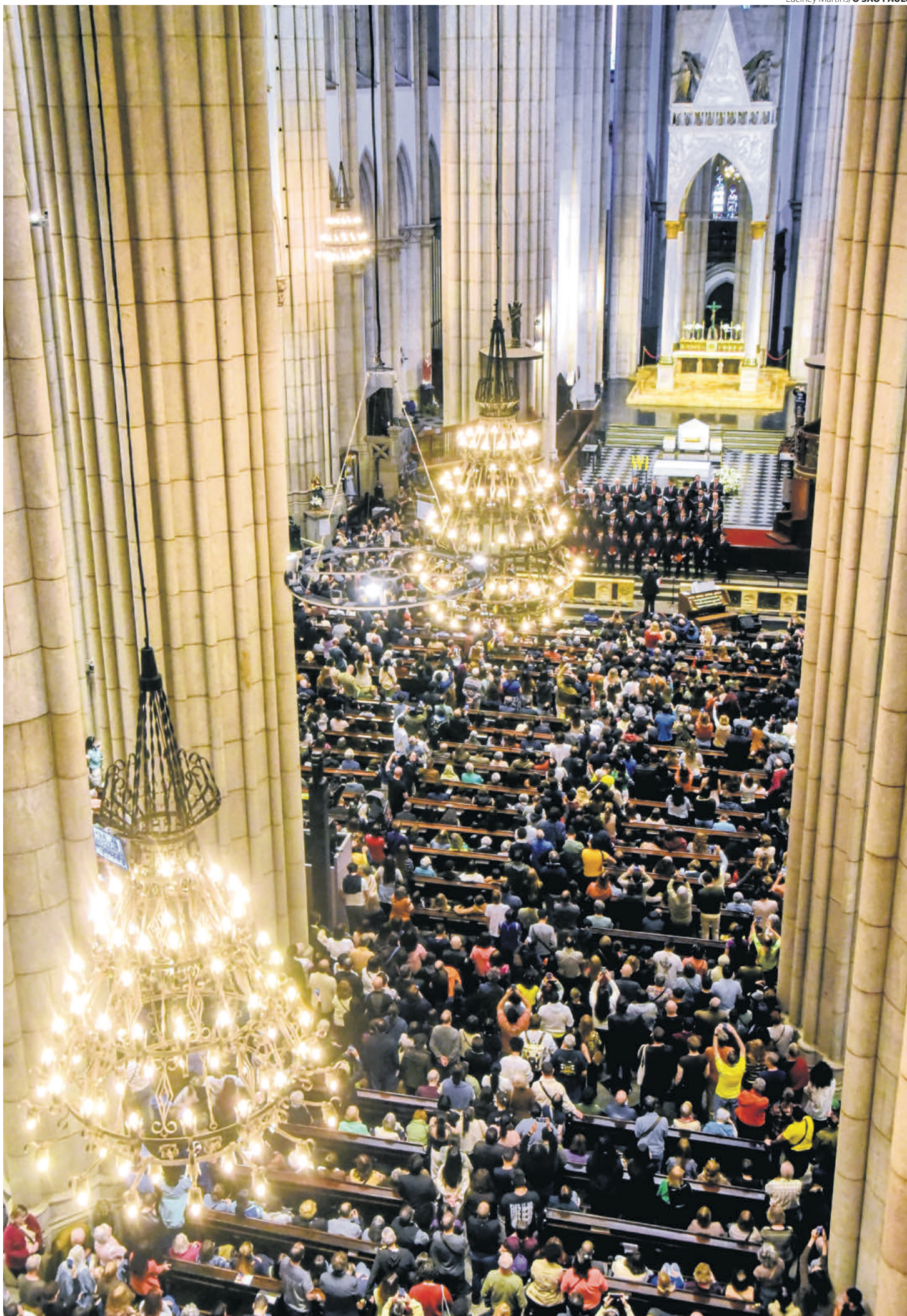
Após São Paulo, Cappella Musicale Pontificia “Sistina” continua a turnê inédita por Curitiba, Brasília e Rio de Janeiro Página 8