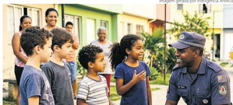
Imagem gerada por Inteligência Artificial

Não há, portanto, escolha entre os dois caminhos. Há apenas um caminho – e ele exige os dois, integrados, contínuos e orientados para a dignidade de cada pessoa que vive nos territórios mais vulneráveis do nosso país.