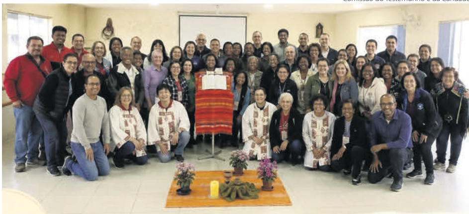
Comissão do Testemunho e da Caridade